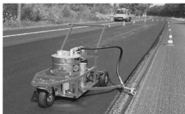
* Plastomat standard (4930 Euro)