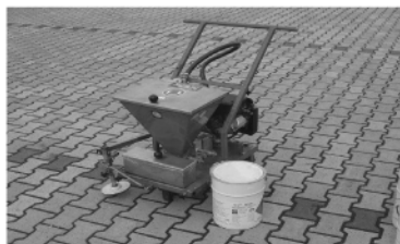
* Plastomat mini (2200 Euro)

Klej do spoin BIGUMA PLAST nanosi się ręcznie – szpachelką, pędzlem lub mechanicznie – przy użyciu zalewarek, które gwarantują łatwe i dokładne nanoszenie kleju. Klej należy wbudowywać na całej wysokości bocznej ścianki (nie wyżej niż górna krawędź nawierzchni), grubością 3-4mm. Unikać należy grubszych warstw, ponieważ istnieje niebezpieczeństwo miejscowego rozpuszczenia bitumu przez zawarty w kleju rozpuszczalnik, co po pewnym czasie może zaowocować powstaniem ubytków. Czas schnięcia naniesionego kleju zależy od warunków pogodowych. Wbudowanie drugiej nitki - gorącej mieszanki mineralno asfaltowej można rozpocząć zaraz po wbudowaniu kleju BIGUMA PLAST (rozpuszczalnik odparuje w wyniku kontaktu z gorącą masą) lub z opóźnieniem (nawet następnego dnia), pod warunkiem jednak, że krawędź zostanie zabezpieczona przed zabrudzeniem i zniszczeniem mechanicznym.